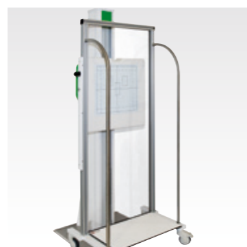
Stitching-Trolley für digitale Aufnahmetechnik. Stitching trolley for digital exposure technique.